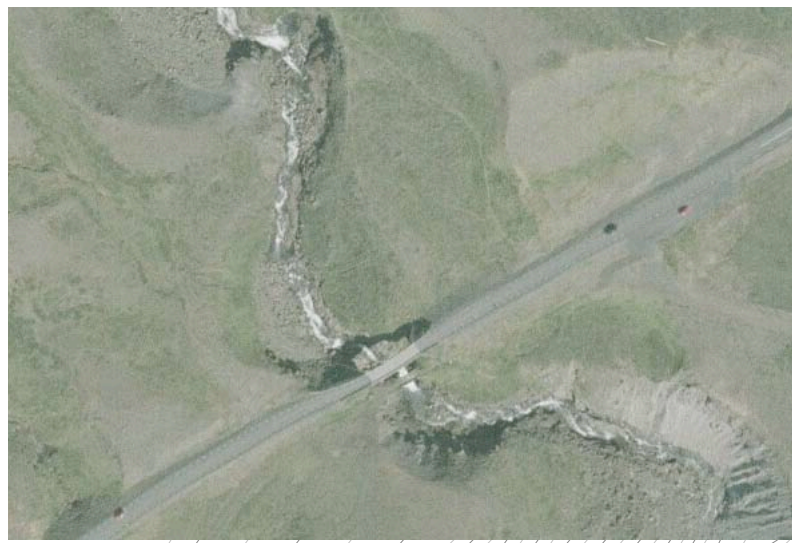
Aðstæður á brúarstað (loftmynd)